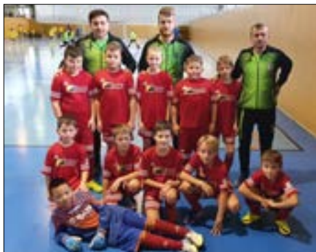
Starší přípravka v Mostě