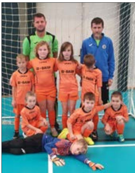
Mladší přípravka – halový turnaj Jirkov