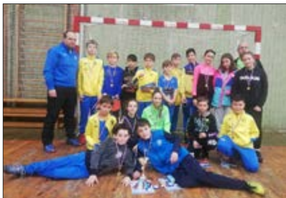
Mladší žáci – halový turnaj Rakovník