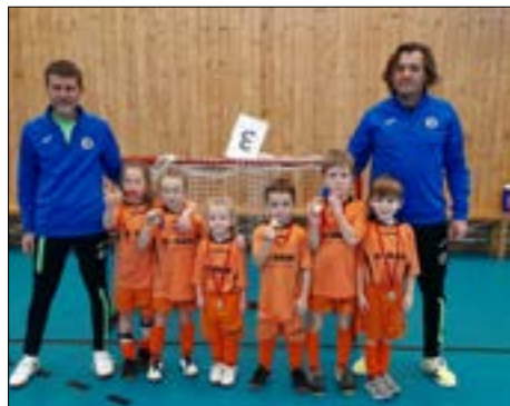
Bambiny – halový turnaj Jirkov