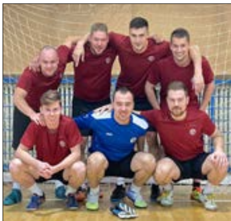
A tým halový turnaj Louny

Po skončení podzimní části sezóny jsme sice zazimovali hřiště, ale určitě nezahálíme. Všechny naše týmy trénují v tělocvičnách a na umělé trávě v Postoloprtech. Zároveň se účastníme halových turnajů. Celkem v zimním období plánujeme odehrát 30 mládežnických turnajů. Neustále se snažíme, aby byly děti v pohybu i v době, kdy má fotbal tzv. „zimní přestávku“. U týmů dospělých v případě příznivé pandemické situace plánujeme v únoru 4 denní soustředění v Heřmanicích, abychom byli na začátek jarní části sezóny, která pro nás začíná 12. 3. zápasem v Rumburku, co nejlépe připraveni a dokázali jsme výrazně promluvit do předních míst tabulky.