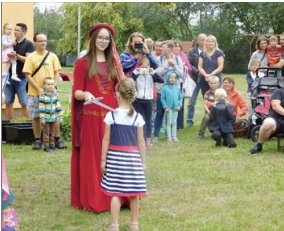
Za kolektiv MŠ Mgr. Ludmila Jirotková