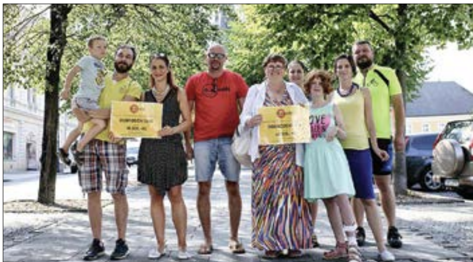
Foto z předávání výtěžku z Dobrodění (z minulého čísla), který je věnován handicapovaným.