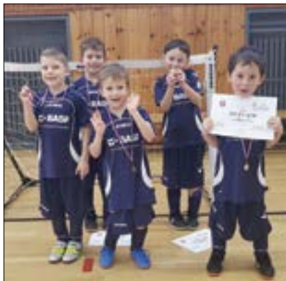
Ti nejmladší, ročník 2013, turnaj Louny