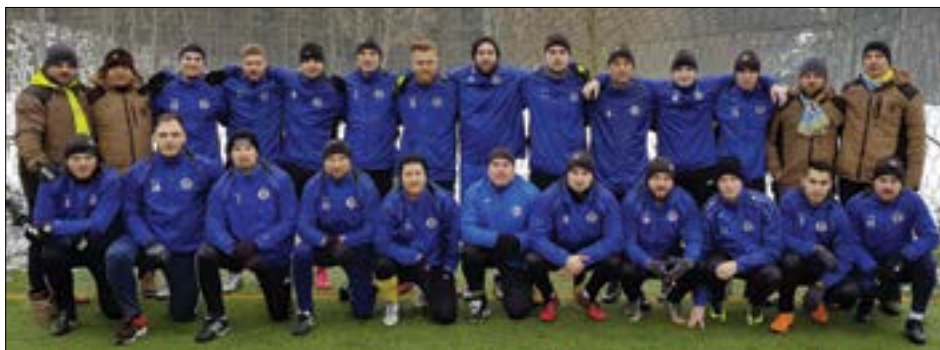
Zimní soustředění Heřmanice v Podještědí 31. 1. – 3. 2. 2019

Ani v zimním období naši fotbalisté nezahálí a pilně se připravují na jarní část sezóny, která rozhodne o konečném umístění. Napínavé budou především zápasy dospělých, kde naše „A“ mužstvo bude při své premiéře v Krajském přeboru bojovat o udržení v této soutěži. V současné době nám patří 13. místo v šestnáctičlenné tabulce a každý náš zápas bude velmi důležitý! První domácí utkání jsme měli odehrát na domácím hřišti 9. 3. proti Brně, ale z důvodu nezpůsobilé hrací plochy jsme kláně přeložili na 8. 5. Takže naše první jarní utkáním bude 16. 3. v Perštejně (soupeři máme co vracet, jelikož doma jsme mu podlehli 2:5). I na jaře se můžeme těšit na lounské derby, které odehrajme 2. 6. s FK Louny na jejich stadionu.