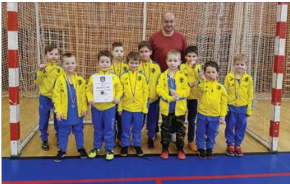
Mladší přípravka, turnaj v Rakovníku