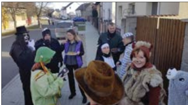
Masopust