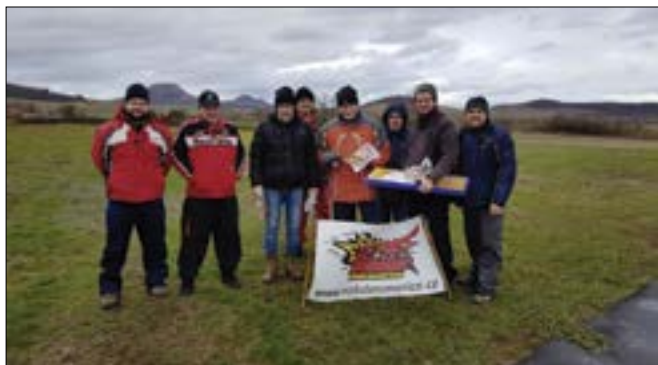
Zimní EPP Combat

První lednový den, jsme se tradičně sešli na letišti, abychom nejen přivítali nový rok 2019 jako kamarádi modeláři, ale abychom poprvé vzali RC soupravy do rukou a s pořekadlem jak na Nový rok, tak