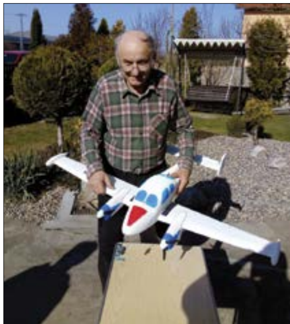
Pavlova Morava I2000 (2)

V zimní čase se moc nelétá a tak se v modelářských dílnách vymýšlí, lepí, řeže, brousí, staví... Malým příkla-