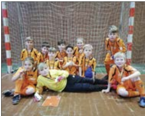
Starší přípravka, turnaj v Povrlech

Tímto zveme všechny fandy fotbalu v Dobroměřicích na naše zápasy, přijďte fandit, budeme to potřebovat.