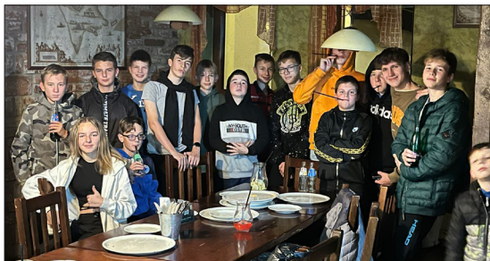
Starší žáci, dokopná bowling Louny

Půlku sezóny všechny naše týmy uzavřely tzv. „dokopnou“ někteří si uspořádali ukončení roku formou turnaje na umělé trávě a opékáním špekáčků s rodiči na hřišti, někteří si zahráli laser game v Mostě a jiní využili bowling v Lounech.