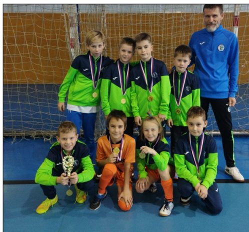
Mladší přípravka, turnaj v Mostě 5. místo

Práce s tolika dětmi je pro trenéry velice náročná, ale trenéry to baví. A je vidět, že svojí práci dělají dobře. Pro naše týmy dospělých jsme si již vychovali řadu kvalitních hráčů, zároveň jsme umožnili přestupy talentovaných mládežníků do týmů, které se fotbalu věnují profesionálně (FK Teplice, FK Baník Most). Těmto dětem přejeme, aby z nich jednou vyrstli hráči jako je Messi, Mbappé nebo Ronaldo.