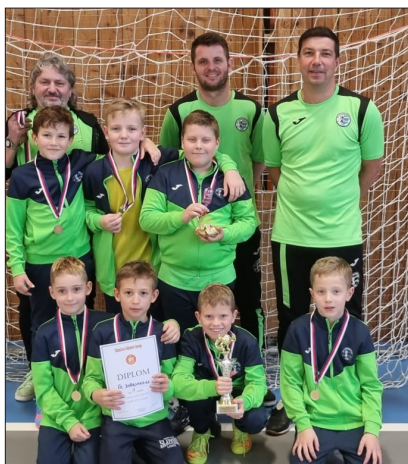
Starší přípravka, turnaj v Krupce 1. místo