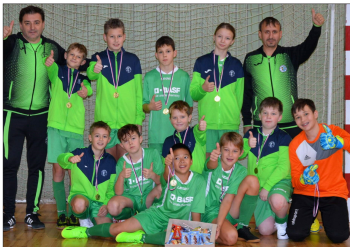
Mladší žáci, turnaj v Rakovníku 5.místo

Neméně dobře si vedou naše mládežnické týmy. U mládeže nám jde především o to, abychom pro děti měli kvalitně připravené tréninky. Naším trenérům, zajišťujeme trenérské kurzy, snažíme se, aby měli kvalitní zázemí, tréninkové pomůcky, prostě vše, co je v našich silách. Samozřejmě i zde se hraje na vítězství a tabulky a naši trenéři se snaží o co nejlepší umístění. Z výher mají děti, trenéři, přihlížející rodiče a fanoušci radost, z proher se vždy naši trenéři snaží ponaučit a děti následně namotivovat na tréninky a další zápasy. Děti musí fotbal bavit. A troufnu si říci, že u nás v Dobroměřicích děti fotbal baví. Dokazují to i počty dětí v jednotlivých kategoriích. Např. v kategorii těch nejmenších „Bambiny – věk dětí 4 – 6“ jsme měli před dvěma lety maximálně 10 dětí, dnes jich máme 23, stejné nebo podobné počty dětí máme u všech mládežnických týmů.