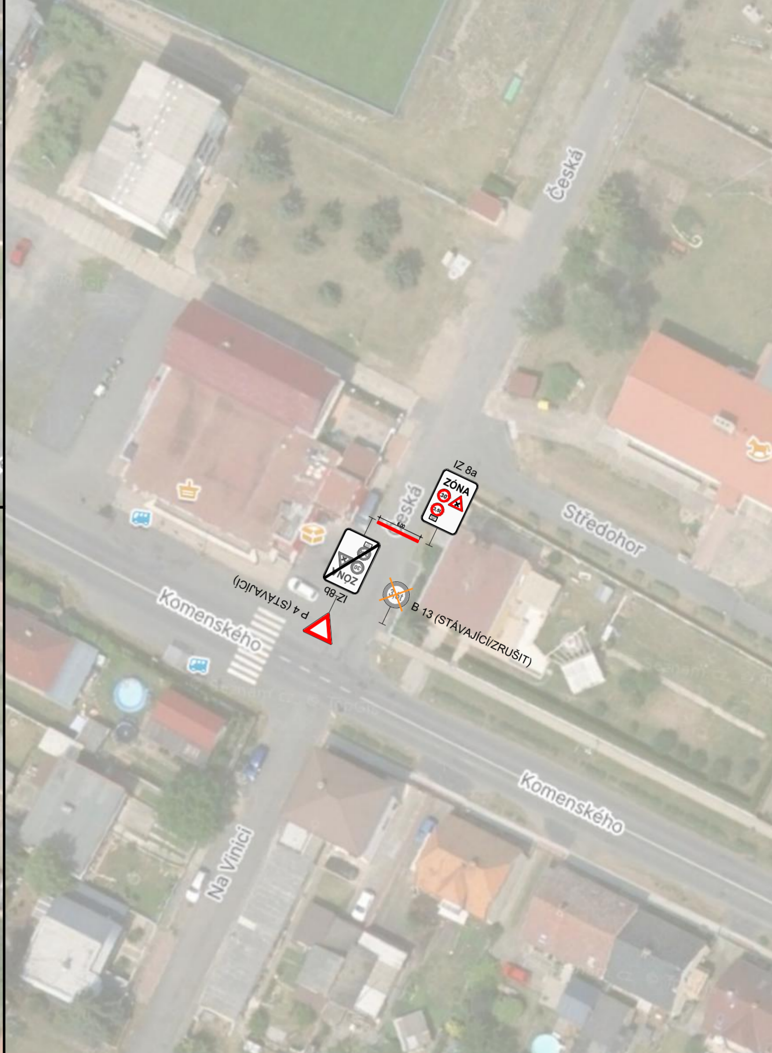
VÝŘEZ A - KŘIŽOVATKA UL. ČESKÁ/KOMENSKÉHO M 1:250