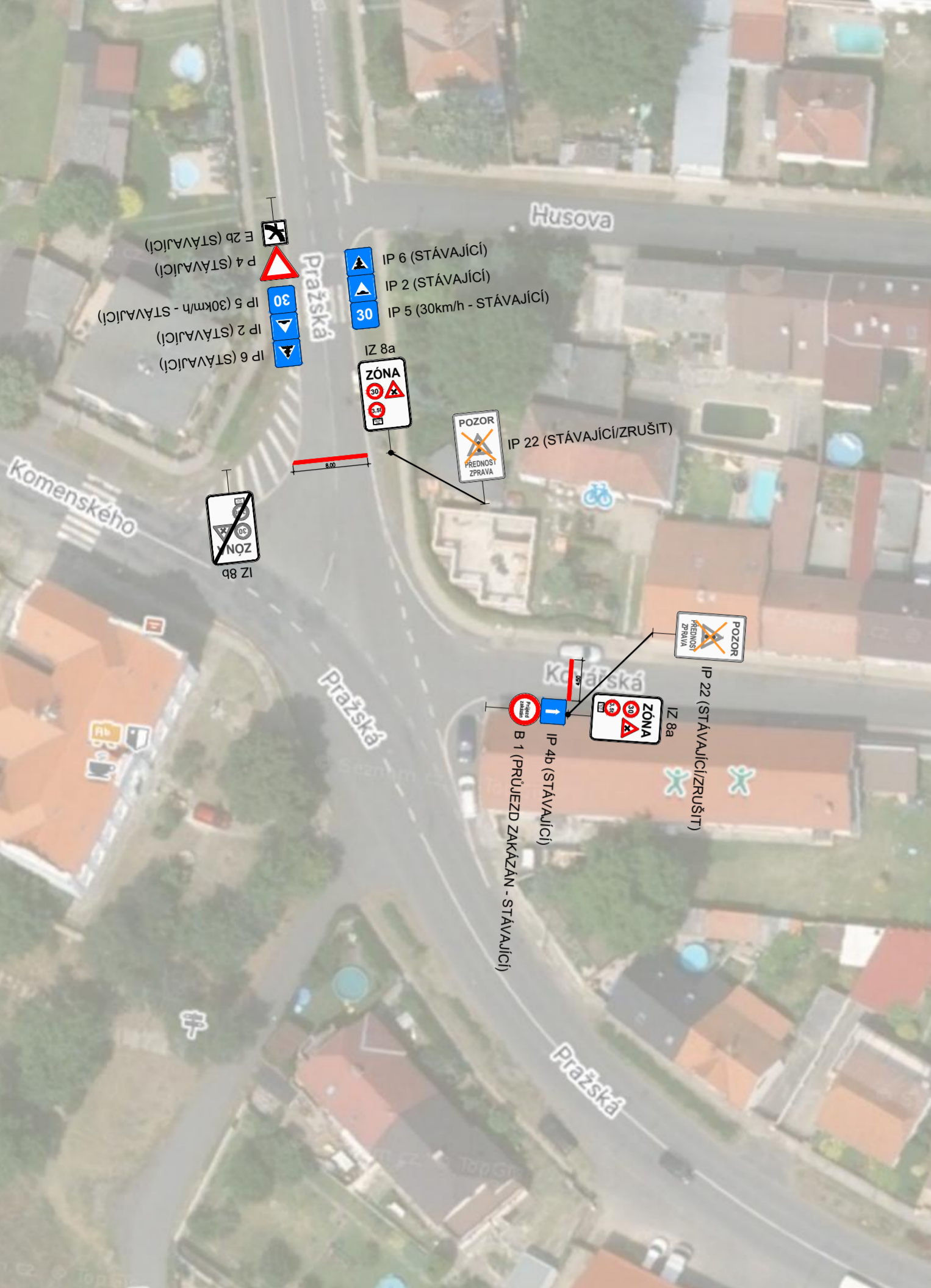
VÝŘEZ B - KŘIŽOVATKA UL. PRAŽSKÁ/KOMENSKÉHO/KOVAŘSKÁ M 1:250