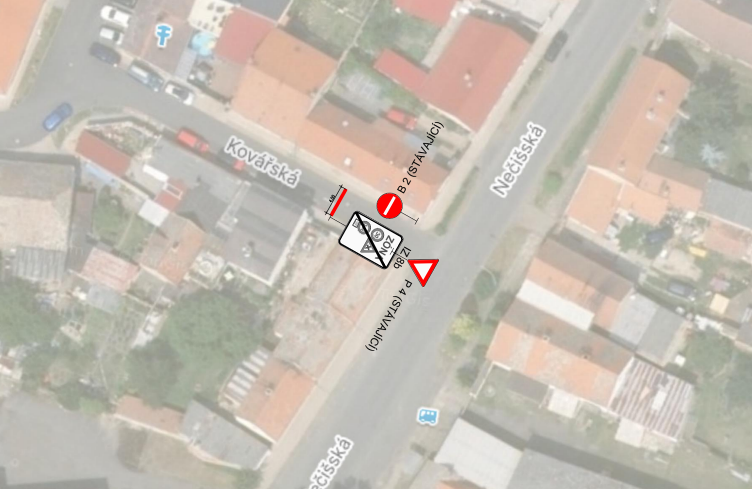
VÝŘEZ C - KŘIŽOVATKA UL. KOVAŘSKÁ/NEČIŠSKÁ M 1:250